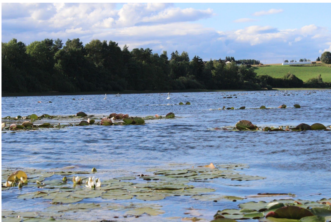
Fra fuglelivet i Synneren, et av naturreservatene som leder ut i Storelva