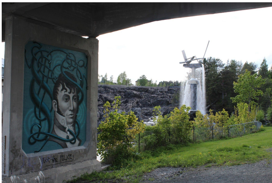
Malerkunst under broen og Asle Raaens vannskulptur.

De Grønne vil skape et samfunn hvor vi har gode liv uten at vi ødelegger for andre. Ved å styrke kommunens levende lokalsamfunn, og gi gode muligheter for medvirkning, gjør vi Ringerike tryggere, vennligere og mer inkluderende. Alle skal føle seg velkommen i Ringerike. I dag finnes det fortsatt mange strukturelle og sosiale hindringer for god integrering, som vi må jobbe aktivt for å nedbygge. Frivillig arbeid er en massiv ressurs for samfunnet, og gir økt livskvalitet og sosial utvikling til enkeltmennesker og lokalsamfunn. De Grønne i Ringerike vil sette kommunen på Norgeskartet. Vi vil vise frem verdiene i kommunen (kulturelt, kulturlandskap, natur) og gjøre den attraktiv slik at folk får lyst til å bo i, og besøke Ringerike kommune. Vi ønsker å skape gode bomiljøer og gjenbruke ressurser bedre. De grønne ønsker at kommunen skal satse på økoturisme, samt lokale gründere og lokale virksomheter og som tar i bruk lokale ressurser. Det ligger mye ubrukt potensiale i Ringerike. Vi vil gi liv til Hønefoss by ved å bygge ut parkeringsplasser i gå-avstand til sentrum. Vi vil ha små, lokale aktører i sentrumsområdene som kan tilby kvalitet, ekspertise og solide, varige produkter.