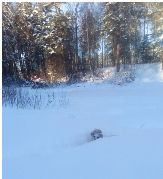
Hund på Petersøya vinter 2019