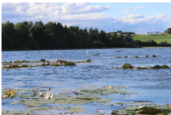
Fra fuglelivet i Synneren, et av naturreservatene som leder ut i Storelva, foto: Knut Arild Melbøe